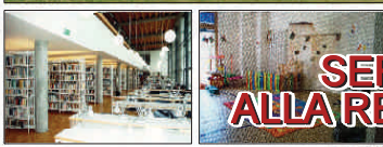
SERVIZI ALLA RESIDENZA