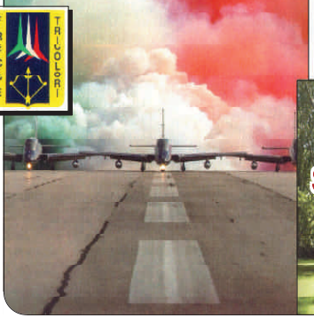
SERVIZI D'AREA VASTA