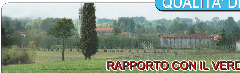
RAPPORTO CON IL VERDE