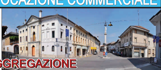
LUOGHI DI AGGREGAZIONE