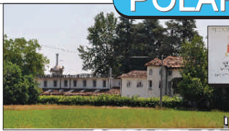
SERVIZI AL TERRITORIO